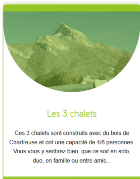
Les 3 chalets