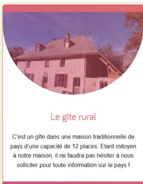
Le gîte rural